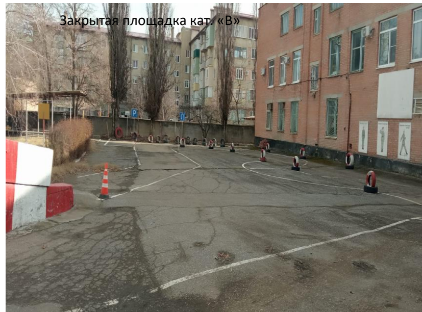
Закрытая площадка кат. «В»