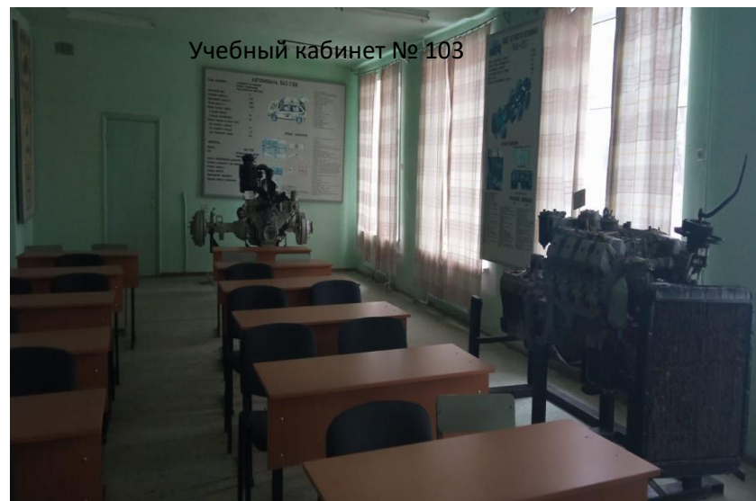
Учебный кабинет № 103