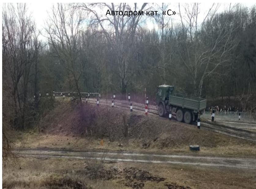
Автодром кат. «С»